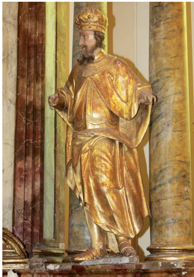
Jobbról és balról két-két oszlop között Szent István és Szent László aranyozott faszobra áll. A párkányzatot angyalszobrok díszítik.