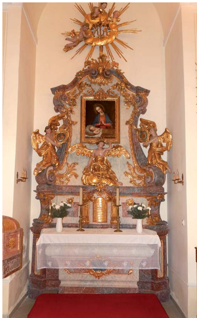
A jobb oldali mellékoltár festménye a győri székesegyház Könyező Madonna kegyképének másolata.