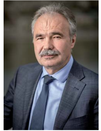
Dr. Nagy István agrárminiszter

A Hédervár Templomaiért Alapítvány tevékenysége a jövőnek is szól. Azt üzeni az eljövendő nemzedékek számára, hogy keresztény gyökereink, templomaink, hagyományaink és kultúránk jelenti a boldogulás útját. Nélkülözhetetlen és jelentőségelteljes munkájukat továbbra is jó szívvel támogatom.