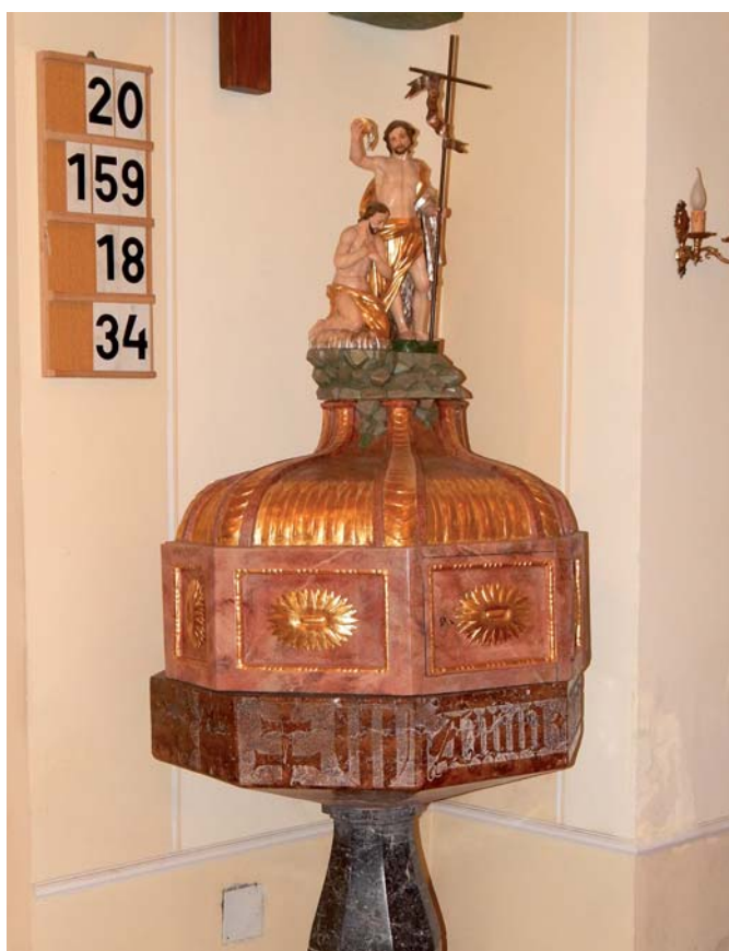
A Szent Mihály-templom legérdekesebb, legértékesebb és korát tekintve legvitatottabb darabja a keresztelőkút. Vörös márványból készült és az Anno Domini 1031 (Az Úr 1031-es évében) évszámot vésték rá.