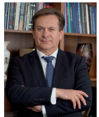
Széles Sándor Főispán

az összetartásra. Ehhez nélkülözhetetlen alapot ad Szigetköz lelkében Hédervár községe. Rengeteg szakrális-művészeti érték mellett természeti adottságai is egyedülállóak a vármegyében. Az eldugott szobrokkal tarkított kastélypark, a falun átcsordogáló patak és a templomok, kápolnák mind-mind olyan érékek, melyek tökéletes kirándulóhelyek. Emellett az itt élőket egy olyan összetartó erővel ruházza fel, mely nagyon ritka. Ezt a kohéziót fontos megragadnia az alapítványnak, a vármegye felelős szereplőinek és megadni az élményt mindenkinek, hogy szerethessük a „drága házat”. Bízom benne, hogy értékőrző és -teremtő munkájukat még hosszú évekig siker kíséri.