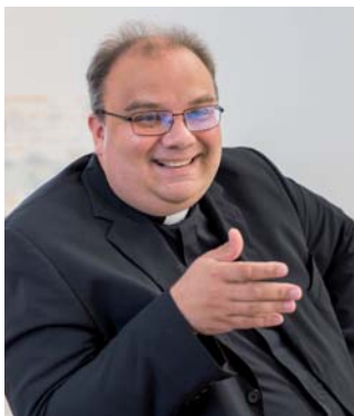
Zsódi Viktor atya SchP, a Piarista Rend Magyar Tartományának tartományfőnöke

A Hédervári Római Katolikus Egyházközség Szigetköz központjában alakult meg, a hagyományok szerint 1031-ben. A több mint ezer éves múlt örökségének gondozása fontos feladata a ma itt élőknek. Ezt az értékőrzést szolgálja az egyházközség tagja által alapított Hédervár Templomaiért Alapítvány, amely több mint negyed évszázada vállal felelősséget az építészeti, művészeti- és kultúrtörténeti örökség megóvásáért.