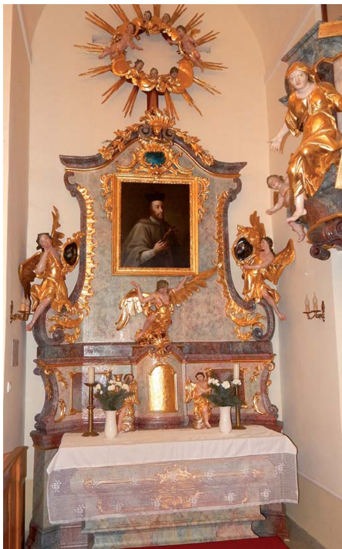
A bal oldali mellékoltár képe Nepomuki Szent Jánost ábrázolja.