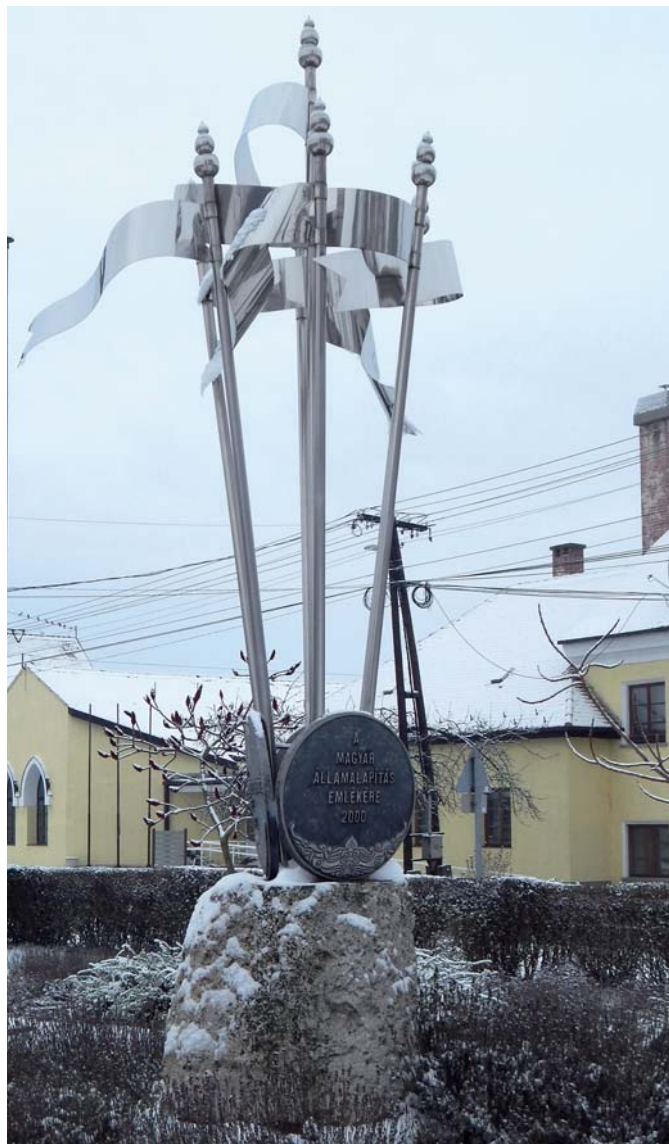
A Magyar Államalapítás emlékére