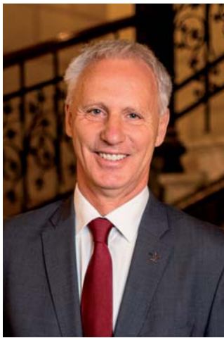
Soltész Miklós Egyházi és Nemzetiségi Kapcsolatokért Felelős Államtitkár

Hazánk Kormánya elkötelezett az egyházak sokrétű tevékenységének és épített örökségének támogatása iránt, mert meggyőződéssel hiszi, hogy egyebek mellett a nevelés, oktatás, szociális felzárkóztatás terén végzett odaadó szolgálat a társadalom számára értéket teremt és mással nem pótolható segítséget nyújt. Ettől a meggyőződéstől vezérelve örömmre szolgál, hogy a Szigetközt, így Hédervárt is magába foglaló nyugat-dunántúli régióban számos egyházi beruházás jöhetett létre az elmúlt esztendőben.